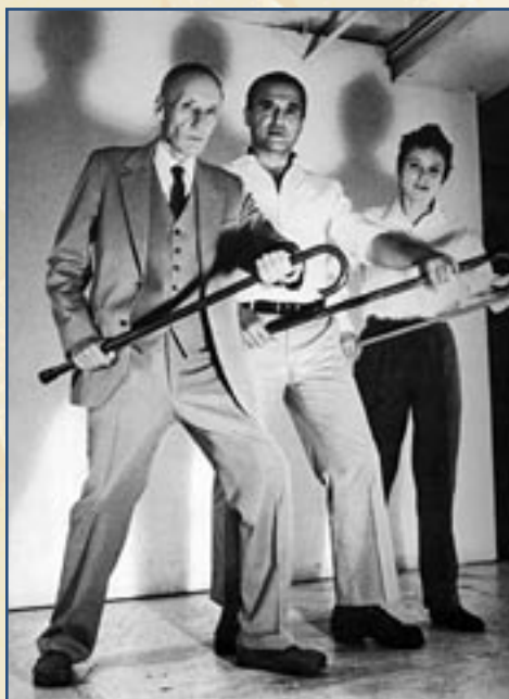
William S. Burroughs, John Giorno et Laurie Anderson, un trio d'enfer, 1981